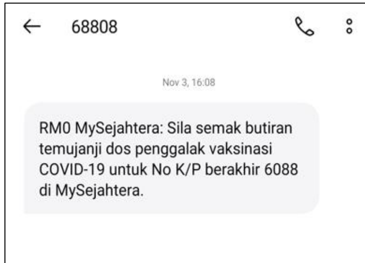
Gambar 1 Contoh Pesanan Ringkas Tarikh Temujanji Mysejahtera