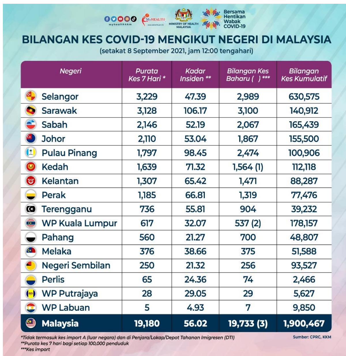
Rajah 3 Bilangan Kes COVID-19 Mengikut Negeri di Malaysia