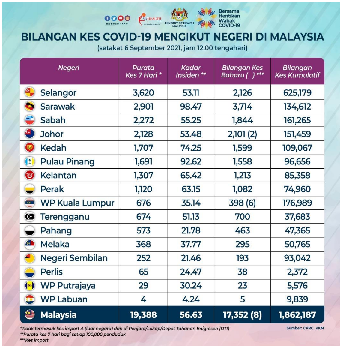
Rajah 2 Bilangan Kes COVID-19 Mengikut Negeri di Malaysia