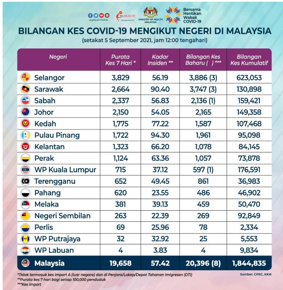
Rajah 2 Bilangan Kes COVID-19 Mengikut Negeri di Malaysia