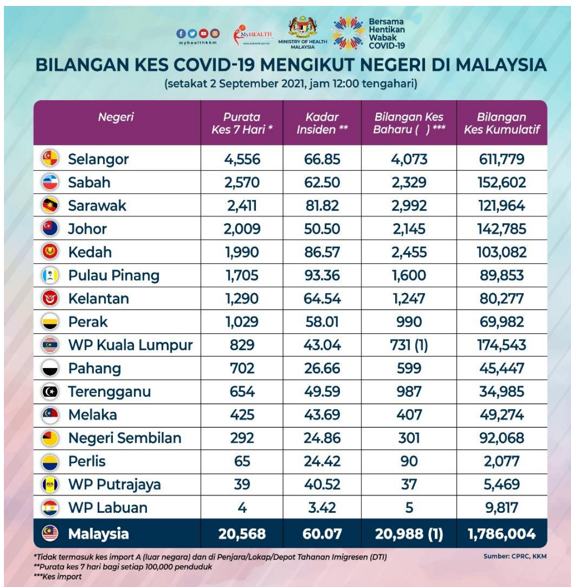
Rajah 2 Bilangan Kes COVID-19 Mengikut Negeri di Malaysia