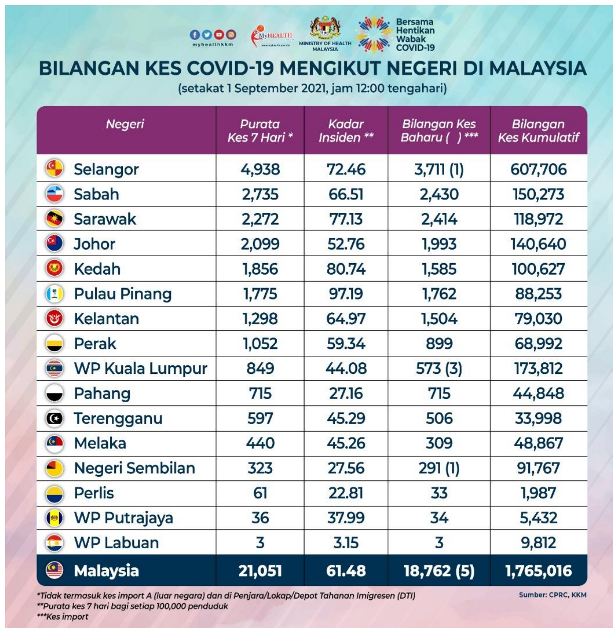
Rajah 2 Bilangan Kes COVID-19 Mengikut Negeri di Malaysia