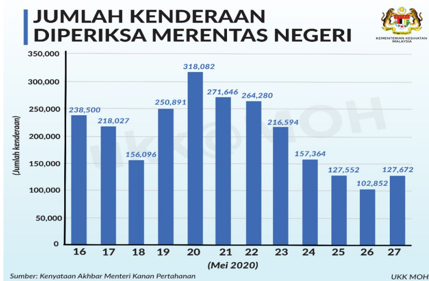
Jadual 1: Jumlah kenderaan diperiksa merentas negeri (16-27 Mei 2020)

Daripada maklumat yang diperolehi semasa Sidang Akhbar YB Menteri Kanan (Kluster Keselamatan), didapati sebanyak 2,449,556 kenderaan telah diperiksa oleh pihak Polis Diraja Malaysia (PDRM) dari 16 Mei 2020 sehingga kini. Dalam tempoh yang sama, sebanyak 18,303 kenderaan yang cuba merentas negeri atas alasan mahu pulang ke kampung dan telah diarah berpatah balik oleh PDRM. Syabas diucapkan kepada pihak PDRM atas usaha ini.